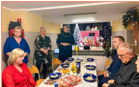
Rada Osiedla nr 6