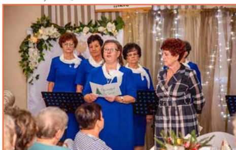
Klub Nauczycielski „Izis”