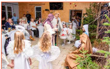
Sołectwo Działoszyn oraz Koło Gospodyń Wiejskich w Działoszynie