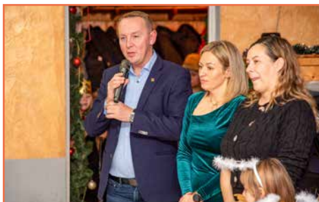
Sołectwo Działoszyn oraz Koło Gospodyń Wiejskich w Działoszynie