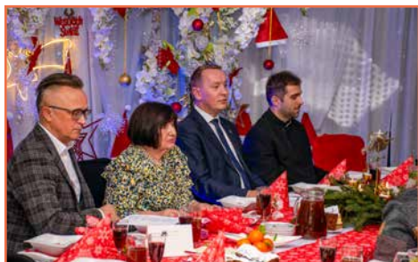
Sekcja Emerytów i Rencistów ZNP w Bogatyni