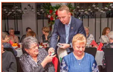
Bogatyńskie Stowarzyszenie Diabetyków „Insulinka”