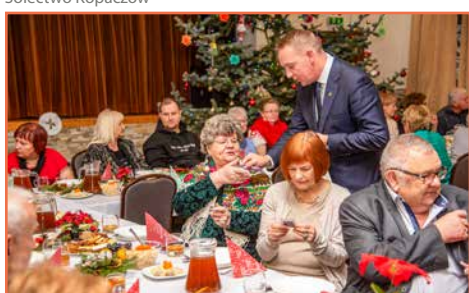
Koło Gospodyń Markocice i zespół Rozmaryn