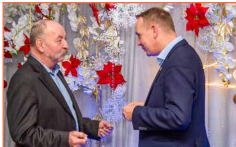
Rada Osiedla nr 2