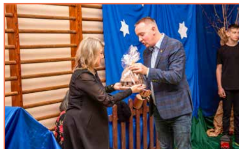
Sołectwo i dyrekcja szkoły podstawowej Opolno Zdrój