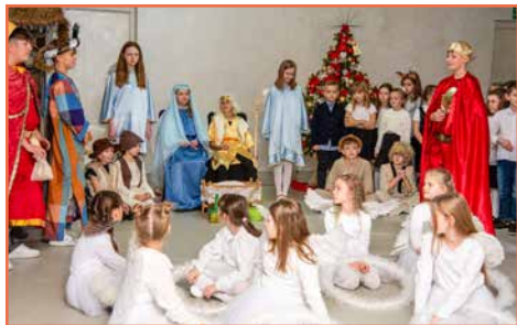
Rada Osiedla nr 2