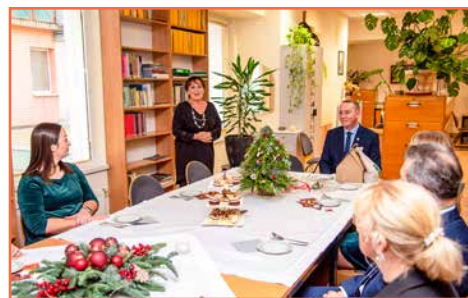
Biblioteka Publiczna Miasta i Gminy Bogatyna

stowarzyszeniach, kołach gospodyń, klubach, radach osiedli czy spółkach, celebrowali ten wyjątkowy czas, kołędując, oglądając przedstawienia jasełkowe i tworząc świąteczne ozdoby.