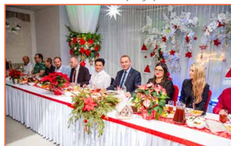
Bogatyńskie Wodociągi i Oczyszczalnia