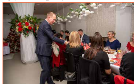
Bogatyńskie Wodociągi i Oczyszczalnia