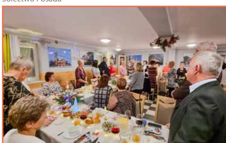
Stowarzyszenie Byłych Pracowników Zakł. Bawełnianych „Doltex”