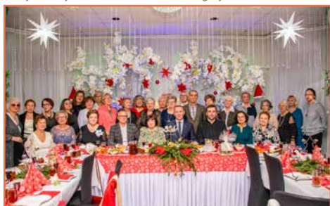
Sekcja Emerytów i Rencistów ZNP w Bogatyni