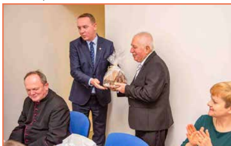
Koło Związku Kombatantów RP i Byłych Więźniów Politycznych