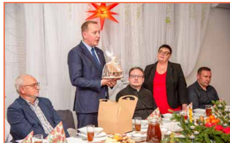
Rada Osiedla nr 7