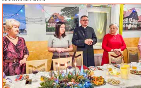
Stowarzyszenie Byłych Pracowników Zakł. Bawełnianych „Doltex”