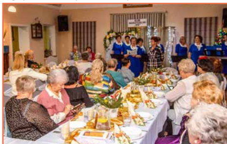
Klub Nauczycielski „Izis”