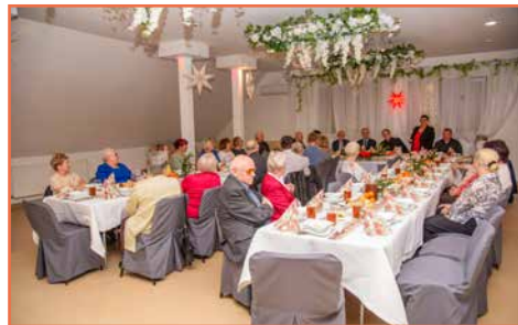
Rada Osiedla nr 7