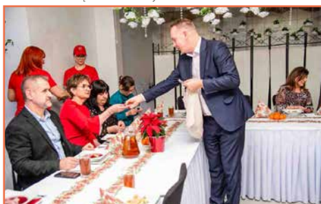
Gminne Przedsiębiorstwo Oczyszczania