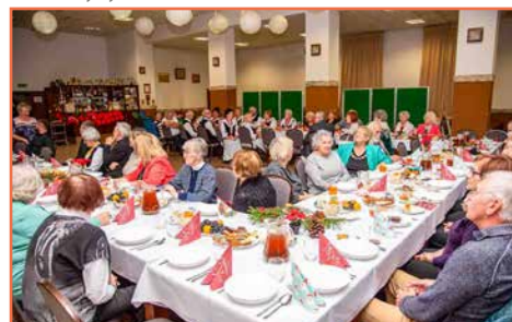
Koło Gospodyń Markocice i zespół Rozmarny