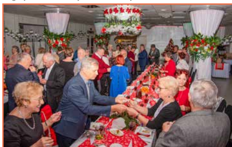
Bogatyńskie Stowarzyszenie Diabetyków „Insulinka”