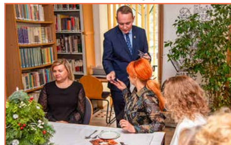
Biblioteka Publiczna Miasta i Gminy Bogatyna