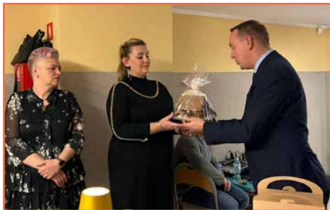
Rada Osiedla nr 6