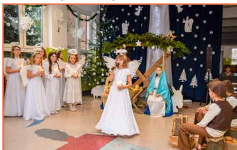
Koło Związku Kombatantów RP i Byłych Więźniów Politycznych