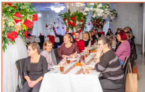
Gminne Przedsiębiorstwo Oczyszczania