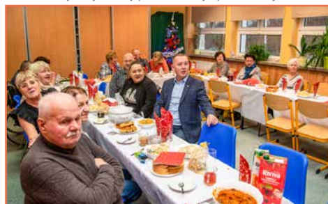
Sołectwo i dyrekcja szkoły podstawowej Opolno Zdrój